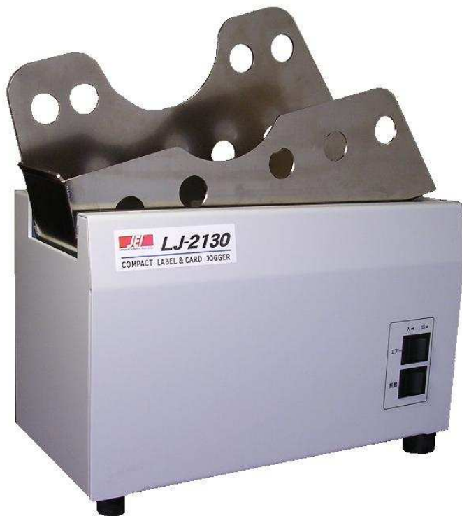
・ジョガー本体の意匠は、性能や機能向上のため予告なしに変更することがあります。